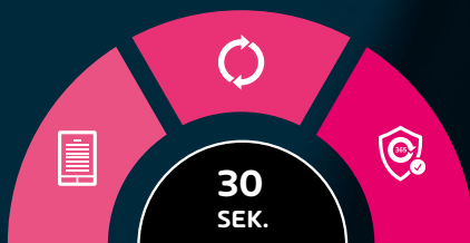
Abb.: Einfacher Onboarding-Prozess in drei Schritten

Mit 365 Total Protection schöpfen Sie das volle Potenzial Ihrer Microsoft Cloud Dienste aus.